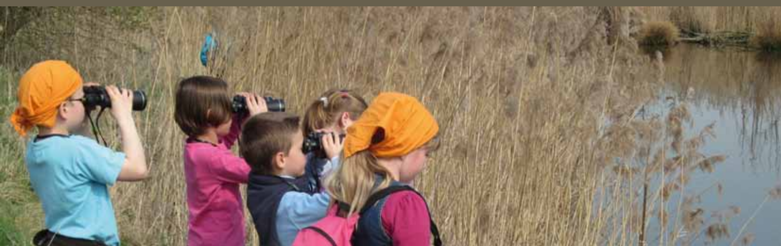
Les animations pédagogiques font bon ménage avec le développement de la faune et de la flore