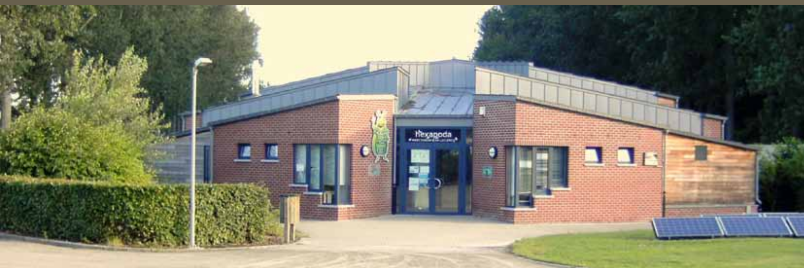
Centre nature aménagé grâce aux subventions régionales (DR) et européennes. www.maisondehesbaye.be