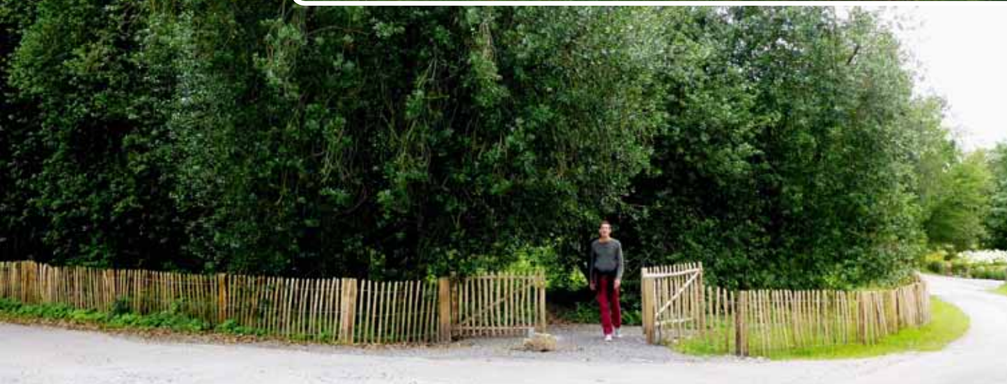
La houssaie de Hazeilles