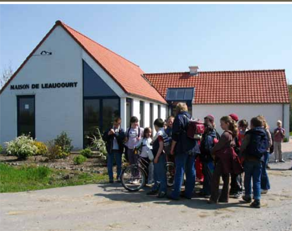
Les enfants des écoles profitent des animations de la Maison de Léaucourt.