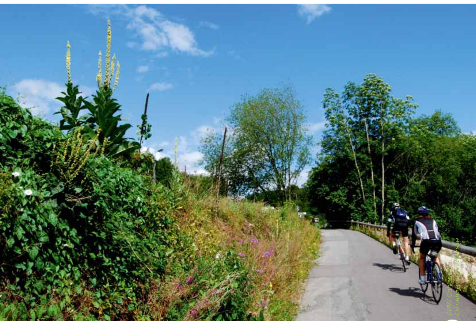
Les voies lentes peuvent constituer des éléments de liaison favorisant la biodiversité