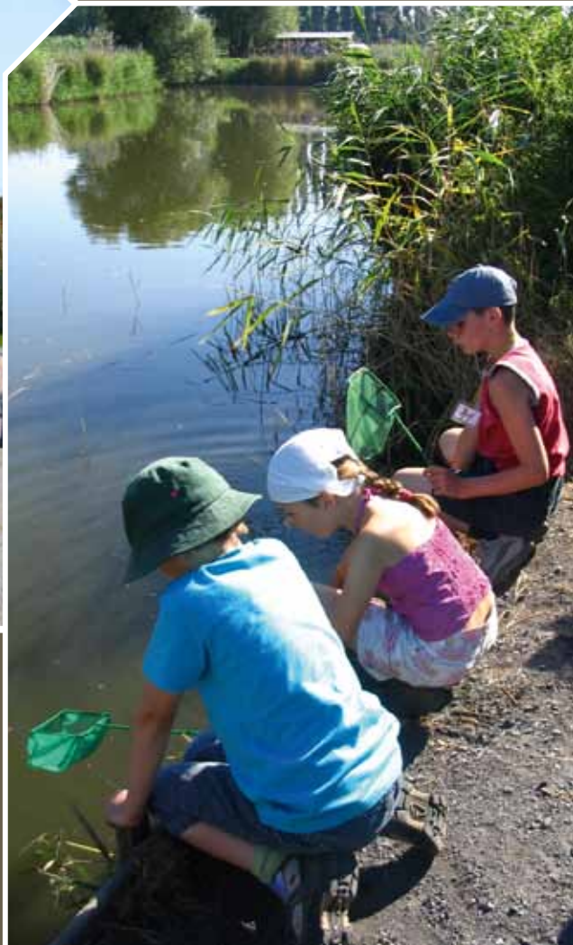
Des espèces sont revenues coloniser le site