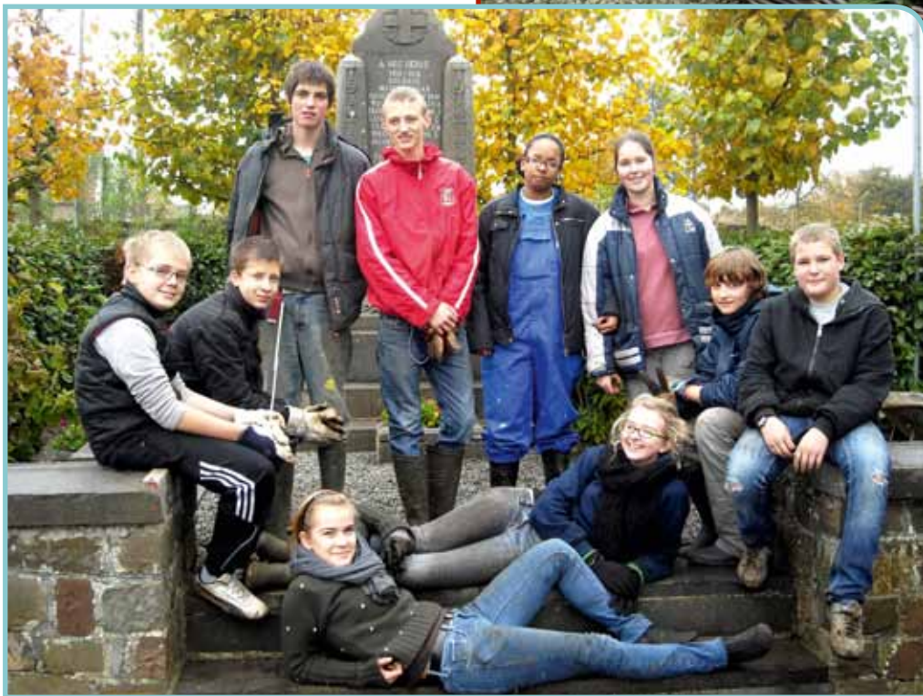
Flanqué du monument aux morts, le lieu est devenu pourtant un point de ralliement de la jeunesse locale.