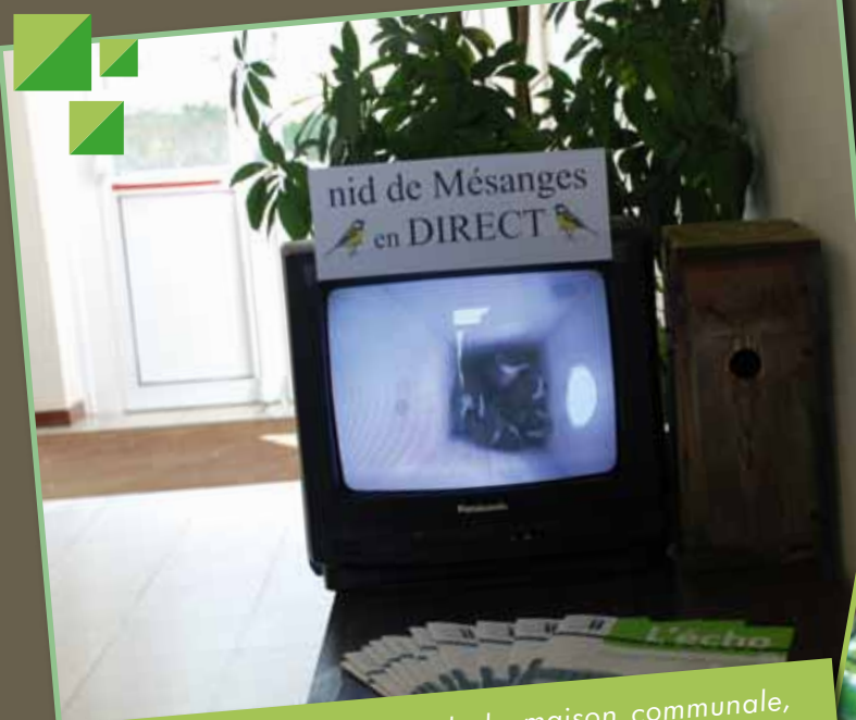
À Beauvechain, à l'entrée de la maison communale, le visiteur peut suivre en direct la vie des mésanges.