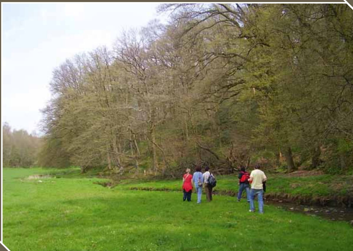
La Commune dispose à présent d'un outil de gestion des espaces présentant un intérêt biologique.