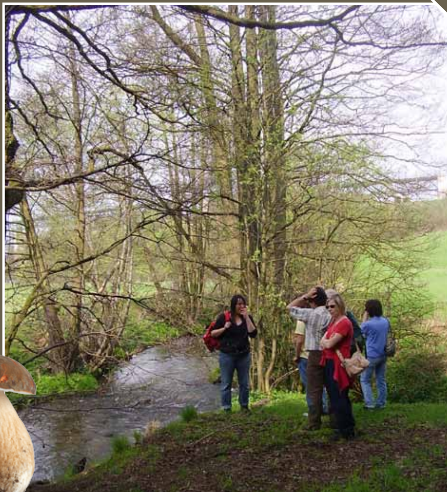
Un inventaire minutieux de 65 sites potentiellement intéressants.