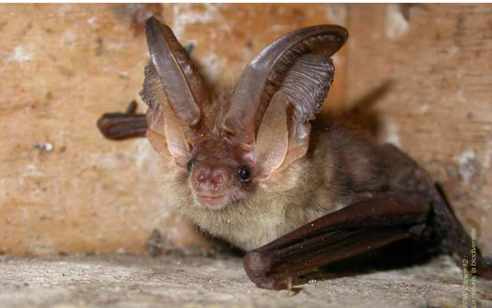
Cet Oreillard commun ( Plecotus auritus ) est un des acteurs de la biodiversité à Beauvechain

Ils ont accompagné deux opérations de développement rural successives qui ont notamment débouché sur l'aménagement de la place communale, l'idée du parking en dalles-gazon et l'envie de lancer un PCDN. Cette dynamique citoyenne a donné de l'élan à une équipe motivée composée des services communaux, des autorités locales et des partenaires du PCDN. Ensemble, ils ont assuré ce chapelet d'actions en faveur de la biodiversité. Nos agents continuent à animer des concertations CLDR-CCATM où des projets sont débattus.