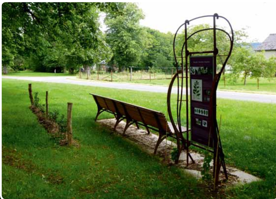
Aire d'accueil en dehors du site classé

Ils ont apporté leur connaissance du territoire et plus particulièrement leurs contacts avec les personnes-ressources qui l'habitent, par exemple, en mettant en relation l'auteur du projet et des naturalistes locaux bien documentés. En outre, ils ont participé à l'élaboration du dossier et à son suivi.