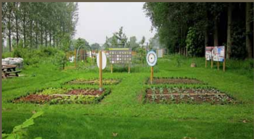
Jardin pour insectes pollinisateurs