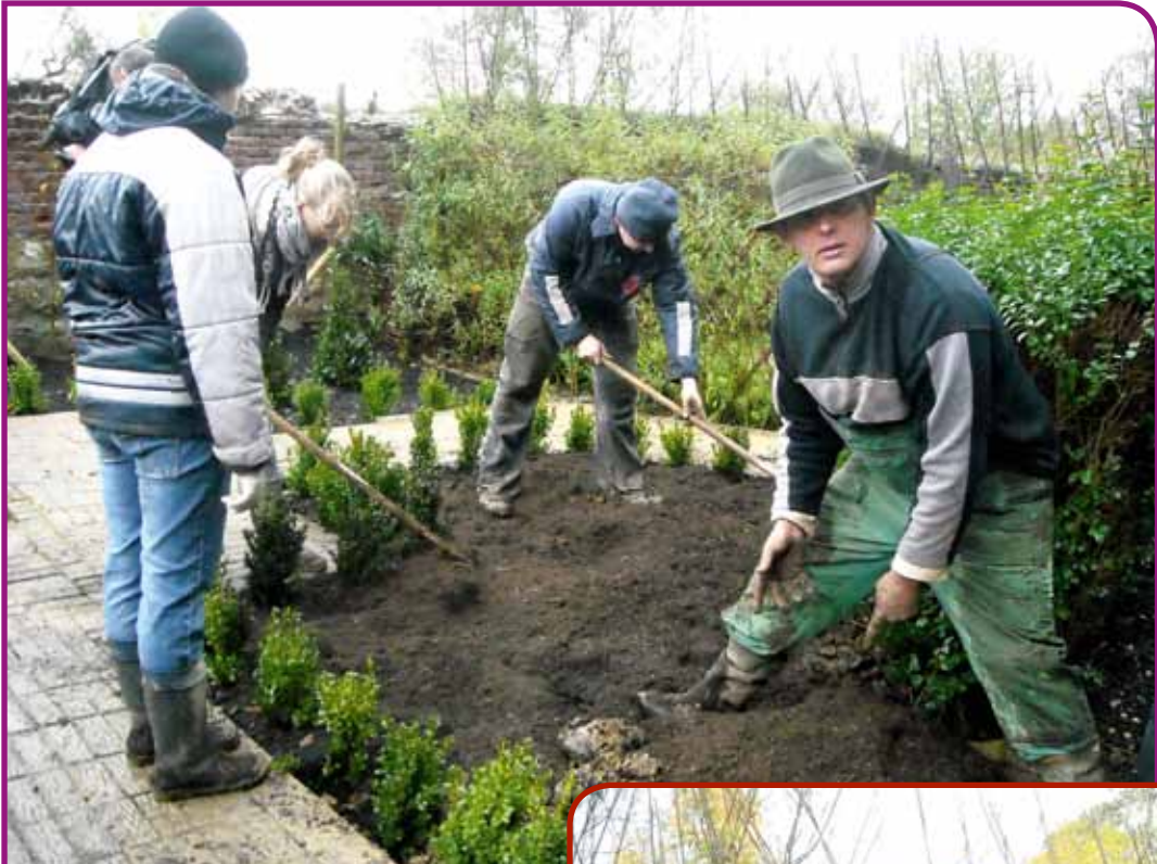
Des plantations pour étoffer le réseau écologique