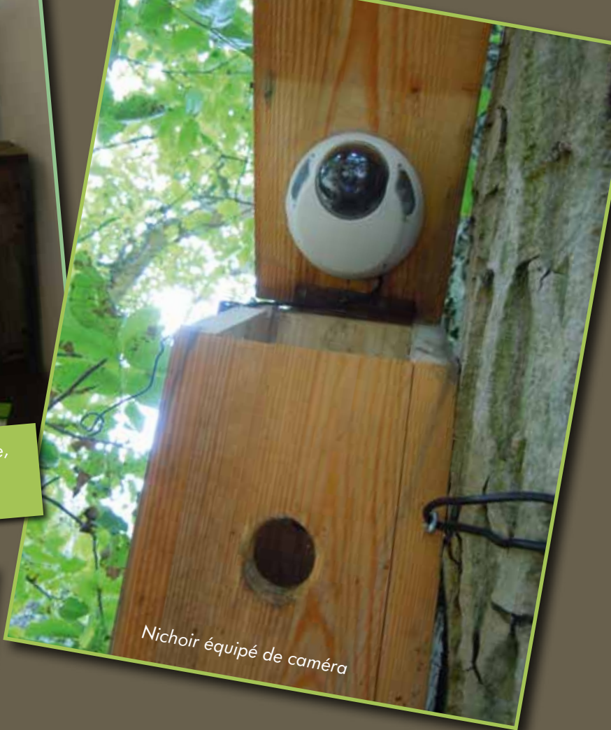
Nichoir équipé de caméra