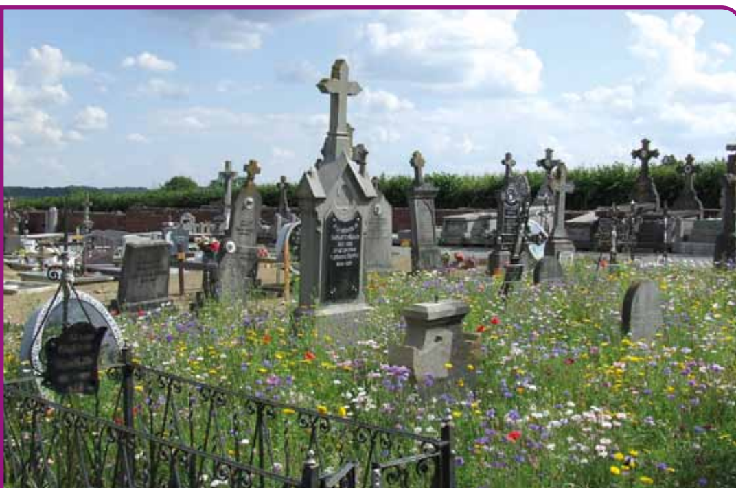
La partie ancienne du cimetière a été semée de plantes mellifères