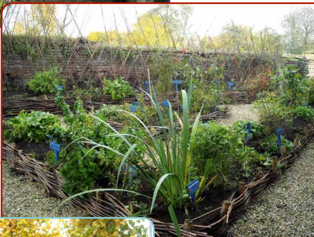
Autrefois friche peu avenante, les abords de l'église se sont transformés en un jardin au naturel.