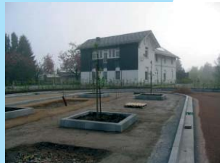
Panneaux solaires sur le toit

Depuis lors, une gare TEC a été aménagée à proximité et des particuliers y ont ouvert un gîte de grande capacité.