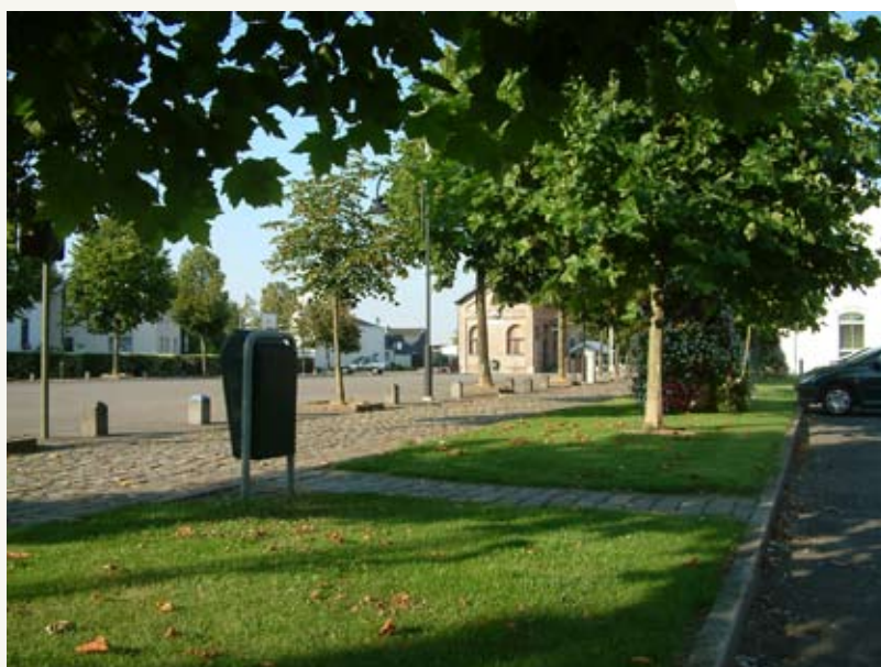
Fig. 13 : Vue de la partie avant. Les revêtements de sol, le mobilier public et la végétation sont mis en place dans un esprit fonctionnel, avec beaucoup de simplicité.

La nouvelle image du site, sa visibilité, son accessibilité et la possibilité de parking sont autant d'éléments bénéfiques au fonctionnement du projet. Ils ont ainsi créé un climat favorable à l'apparition d'autres projets de logements, de commerces et de services (fig. 14).