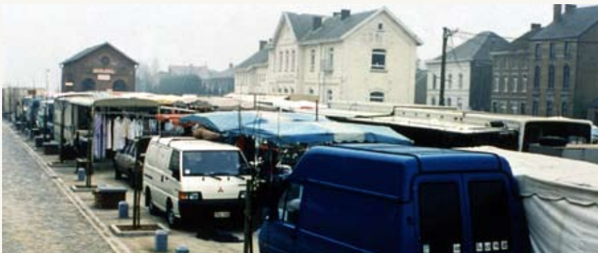
Fig. 6 : La partie avant du site, en relation avec la chaussée de Wavre, est aménagée de manière à accueillir du parking ou, par exemple, le marché hebdomadaire.