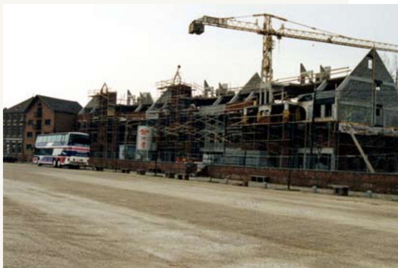
Fig. 14 : Vue de la partie avant. L'aménagement du site a suscité la construction de divers projets privés qui complètent la place.