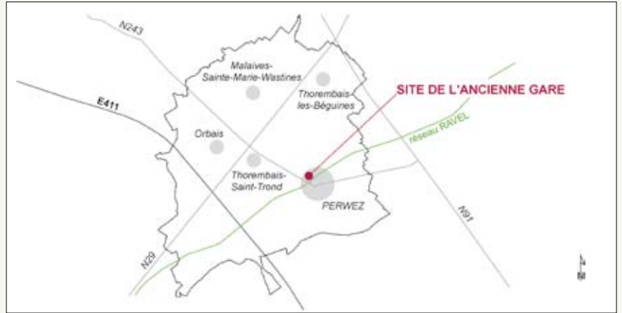
Fig. 1 : Perwez est décentré par rapport aux autres villages de la commune principalement situés au nord de l'entité et demeure éloigné de l'axe principal de communication.

Fig. 3 : Vue de la partie avant. Le site de « l'ancienne gare » devient la « porte d'entrée » de Perwez.