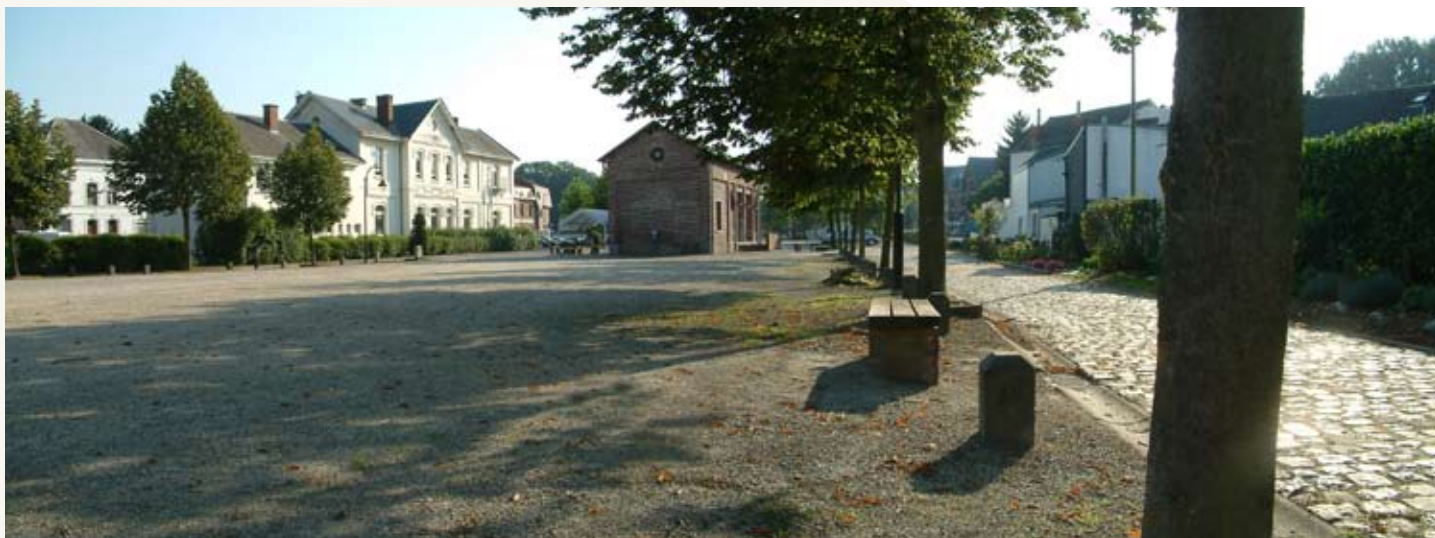
Fig. 12 : Vue de la partie arrière. les aménagements sont sobres et durables.