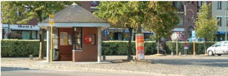
Fig. 5 : L'édicule rassemble divers services. Proche de la chaussée, il constitue un point d'appel.