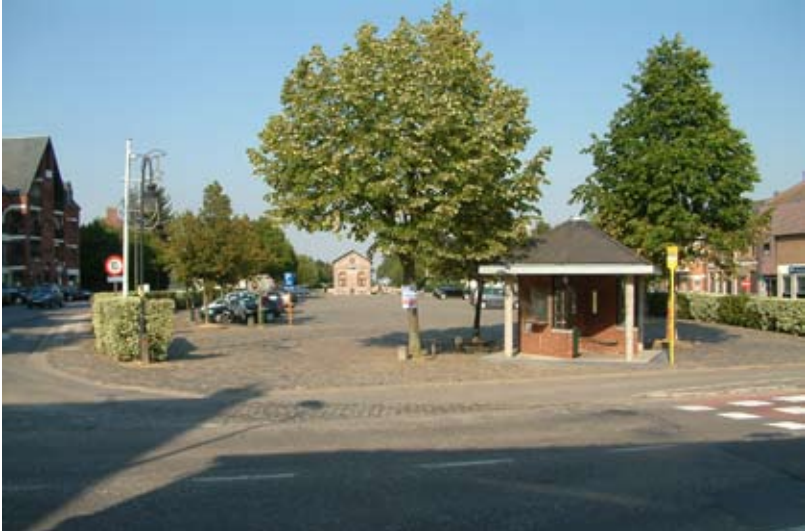
Fig. 10 : Vue de la partie avant. Les aménagements confèrent à cet ancien site ferroviaire un statut de place publique en préservant son esprit de halte.