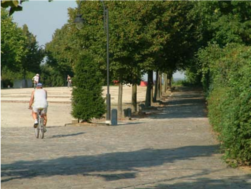
Fig. 9 : Vue de la partie arrière. La circulation piétonne suit l'ancien tracé de la voie de chemin de fer devenu un tronçon du réseau RAVeL. Elle est aménagée en pavés récupérés sur le site et anciennement utilisés pour les quais.