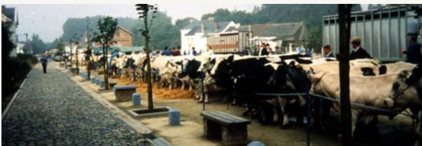
Fig. 7 : La partie arrière du site, recouverte de dolomie, peut être utilisée comme terrains de pétanque ou, à d'autres moments, pour installer un marché aux bestiaux.