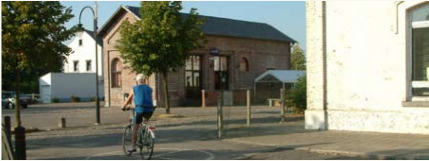
Fig. 4 : Les anciens magasins de la SNCB sont réhabilités en salle communautaire. Par sa position centrale, la salle divise la place en deux parties distinctes.

Cette programmation souple et évolutive constituait une entreprise risquée mais nécessaire à l'adoption par les usagers d'un site ferroviaire désaffecté qui ne possède pas au départ le statut d'une place publique.