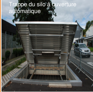
Trappe du silo à ouverture automatique