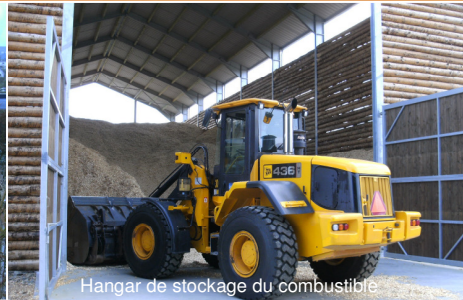
Hangar de stockage du combustible