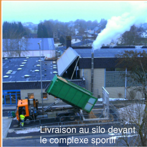
Livraison au silo devant le complexe sportif