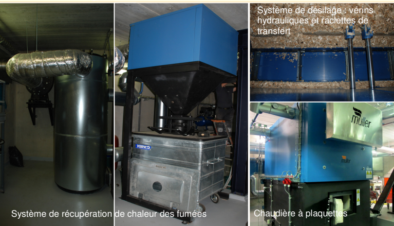
Système de récupération de chaleur des fumées