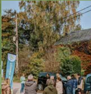
Hannut Inauguration du sentier d'Abolens