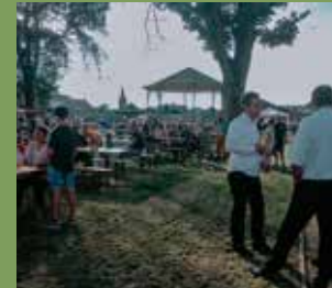
Anhée Aménagement de la place de Salet

L'inauguration d'un projet, c'est la concrétisation d'envies citoyennes, l'aboutissement d'années de travail collaboratif et une pierre de plus dans la construction du futur de la commune. Voici les projets finalisés en 2021.