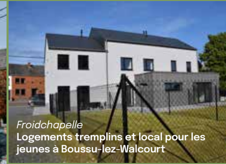
Froidchapelle Logements tremplins et local pour les jeunes à Boussu-lez-Walcourt