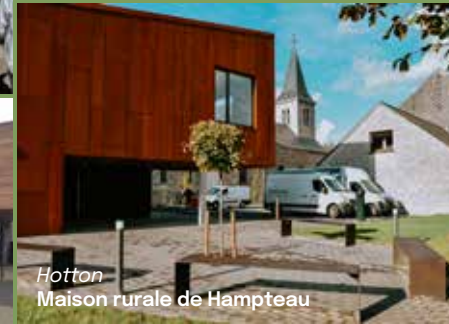
Hotton Maison rurale de Hampteau