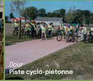
Dour Piste cyclo-piétonne