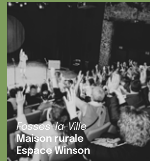
Fosses-la-Ville Maison rurale Espace Winson