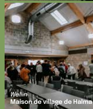
Wellin Maison de village de Halma