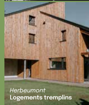
Herbeumont Logements tremplins