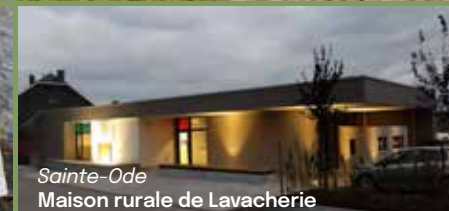
Sainte-Ode Maison rurale de Lavacherie