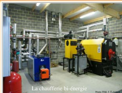
La chaufferie bi-énergie