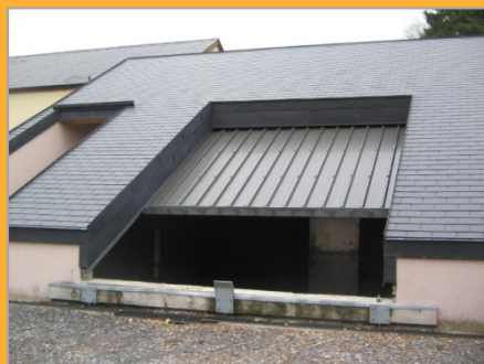
Le silo à plaquettes de bois avec son dessileur rotatif et sa trappe de remplissage intégrée à la toiture de la chaufferie.