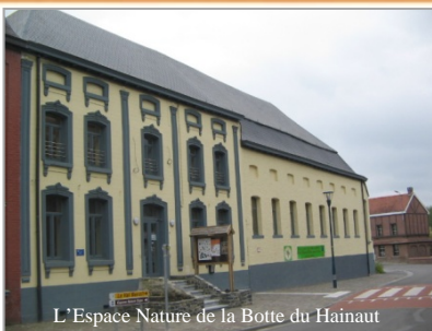
L'Espace Nature de la Botte du Hainaut