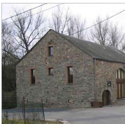
Le caractère massif de ce pignon est préservé par de nouveaux percements ponctuels d'allure verticale.