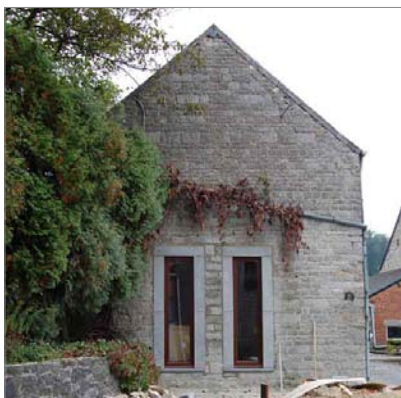
Un nouvel encadrement en pierre souligne les étroites ouvertures créées dans ce pignon.