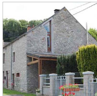
Cette nouvelle ouverture épouse la pente du toit dans sa partie supérieure tout en conservant un caractère vertical.