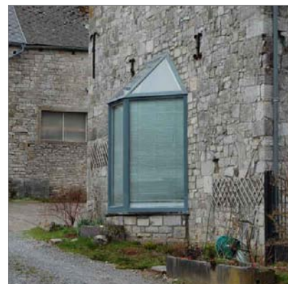
Ce nouveau percement au rez-de-chaussée a été traité à la façon d'un bow-window.