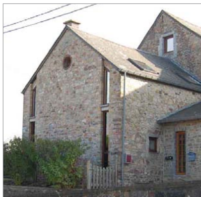
Les étroites ouvertures dans ce pignon regroupent les fenêtres des deux étages de façon symétrique par rapport au faîte du toit.

Dans une maison rurale ou une ferme traditionnelle, il est possible de créer de nouvelles fenêtres dans un pignon tout en respectant les caractéristiques patrimoniales du bâtiment. Les projets proposés ci-dessous illustrent les principes à respecter pour ce type de réalisation : la conservation du caractère massif, le respect de la composante verticale du pignon, des ouvertures au caractère contemporain, de faibles dimensions ou bien regroupées.