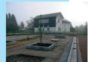
Panneaux solaires sur le toit

Depuis lors, une gare TEC a été aménagée à proximité et des particuliers y ont ouvert un gîte de grande capacité.