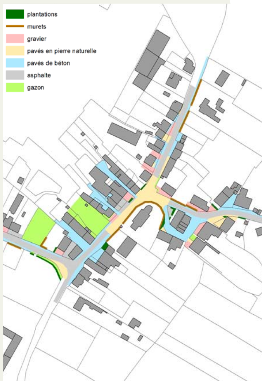
Plan illustrant les matériaux utilisés