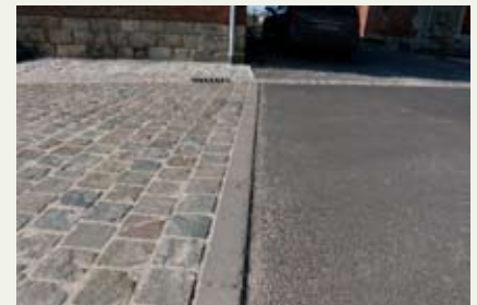
Différenciation du matériau sur le pourtour de l'église