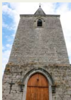
Clocher de l'église

La transversalité a aussi joué avec une mobilisation des compétences mais aussi de différentes sources de financement. Enfin, le processus participatif a permis d'impliquer les habitants, de renforcer les liens sociaux et de dépasser les limites de propriété au profit d'une logique plus globale.