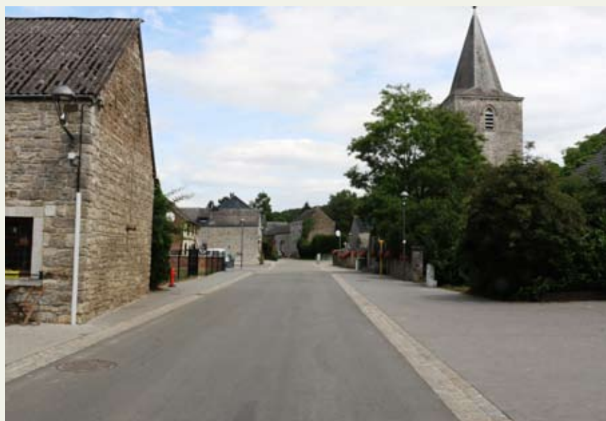
Situation après réaménagements