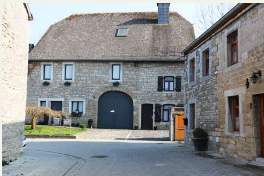
Traitement des voiries de desserte locale