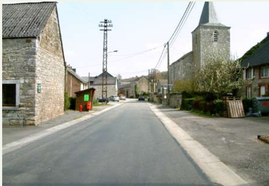
Situation avant réaménagements

Dans un premier temps, en vue de hiérarchiser sans diviser, un travail a été réalisé sur les matériaux de l'espace public.