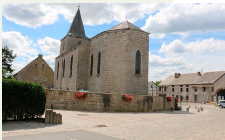
Aménagements autour de l'église