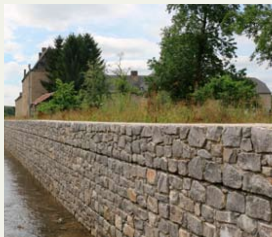
Muret le long des berges du Douyet