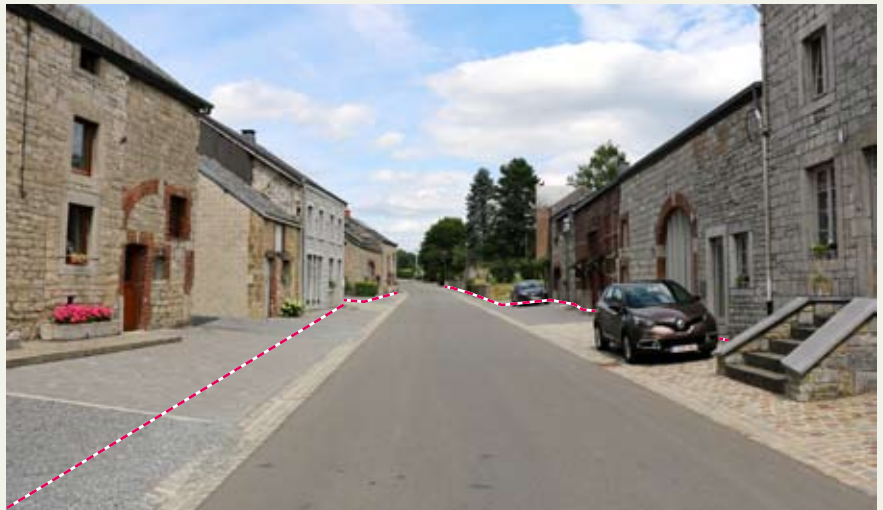
Aménagements et limites privé/public (en rose et blanc)