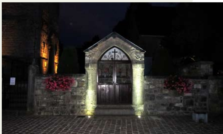
Vue nocturne de la chapelle