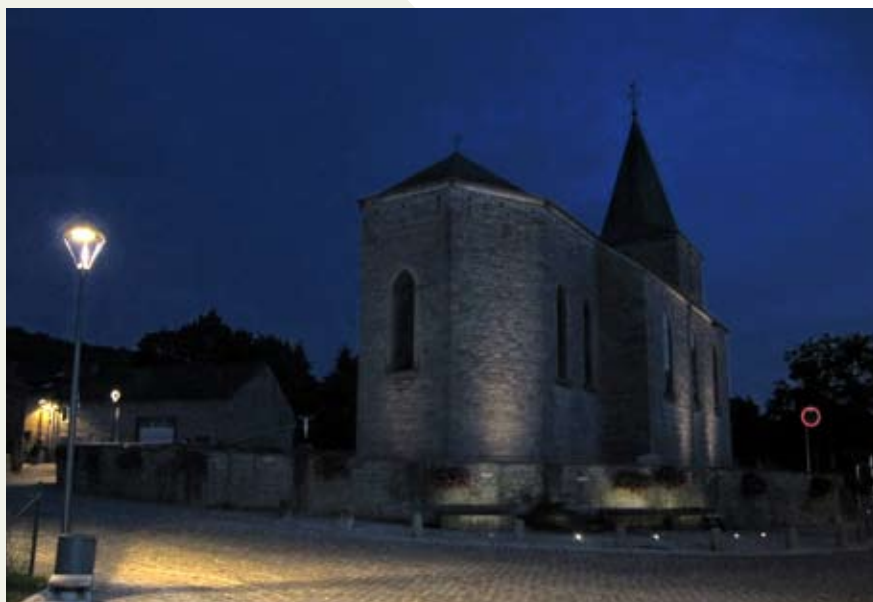
Vue nocturne des aménagements autour de l'église

Enfin, pour ne pas parasiter l'essence même du projet de mise en valeur du centre de Ny, un mobilier sobre qui ne s'impose pas à l'espace a été proposé, tant pour la signalétique que pour le petit mobilier tel que les bancs et poubelles.