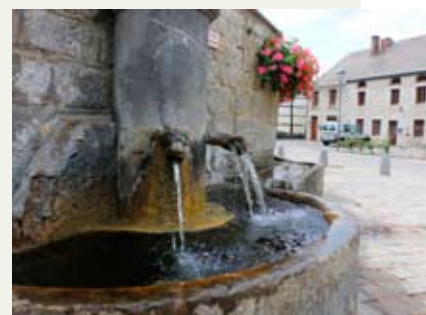
Abreuvoir le long du muret ceinturant l'église