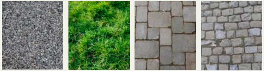
Echantillon de matériaux issus de la charte

La charte a d'abord fait l'objet d'une présentation au Collège communal pour ensuite être présentée à la population. Avant l'élaboration des conventions individuelles entre les riverains et la Commune, différentes permanences ainsi que des entrevues au domicile des riverains (menées par l'éco-conseillère) ont été organisées pour permettre aux habitants de comprendre la charte et d'y adhérer en parfaite connaissance de cause.