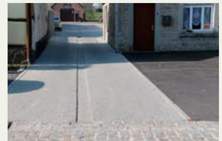
Traitement différencié des venelles