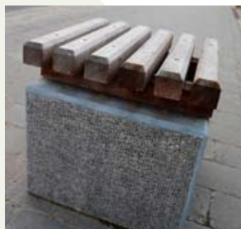
Banc en pierre naturelle