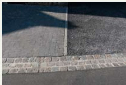
Homogénéité et diversité des revêtements