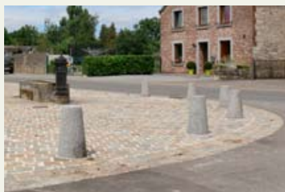
Revêtement en pierre naturelle pour la mise en valeur du petit patrimoine