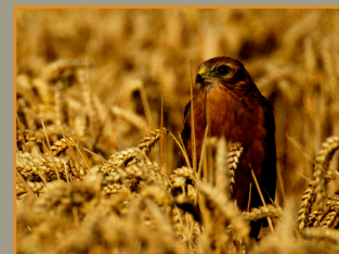
Jeune busard cendré