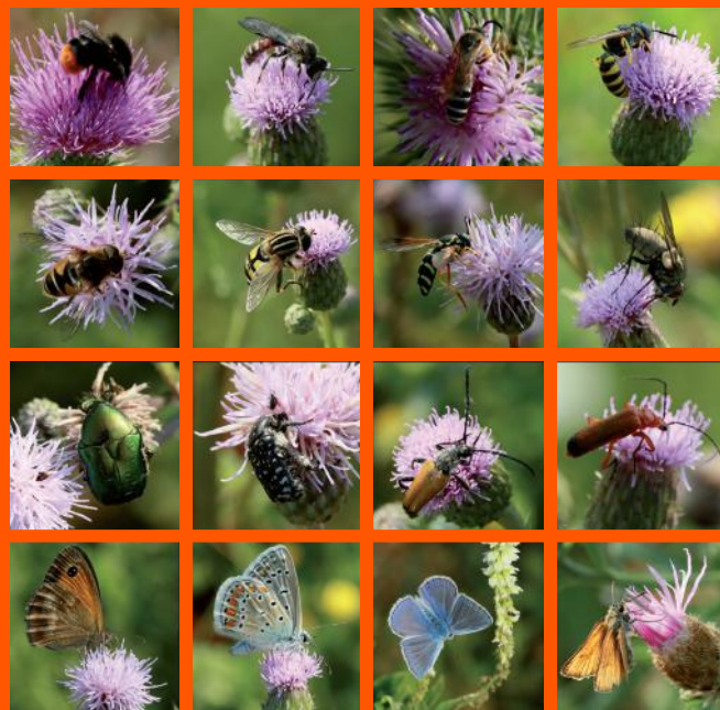
Collection « Pornichet terrain friche chardon » 21/07/13